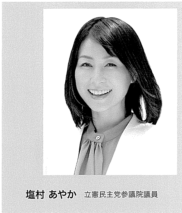
塩村 あやか 立憲民主党参議院議員

逢坂 割と丁寧です。今回も1月には全国から政策の公募をしました。相当件数の政策が集まって、それを公開し、全国の地方議員からも政策に関する声も集めたので、丁寧さ、いわゆるボトムアップというのを心がけてやったことは事実です。2017年の旧立憲民主党がボトムアップと言っていたことも、100%うまく機能したかどうかは別にしても、現在もある程度踏襲しています。