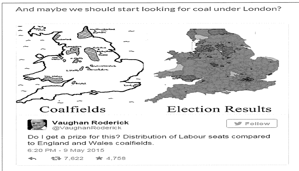
図表2 問題② 労働党「敗北」の意味

も左寄りの社会民主主義的な政策を提示することによって支持を獲得していきました。これがスコットランド・ナショナリズムの内実であったわけです。