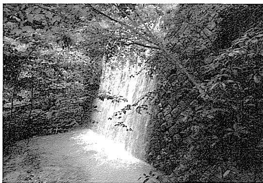
滋賀県比良山系比良川の砂防堰堤

地域の人々が、自発的にエネルギー創造に向かいはじめた例もあります。地熱以外の自然エネルギーにはたいへん恵まれた高知県の例です。高知は、降水量が2500mm以上と日本の平均雨量よりはるかにたくさん雨が、山地率84%という山々に降ります。結果として、高知県はとくに、小水力の適地が数多く存在します。その地元の資源に高知の人々は気付きはじめました。今年の3月末には、高知小水力利用推進協議会が設立されました。そのメンバーの多くは、福島原発事故が起こる前から準備会議に集っていたのです。どのような方々かという、小水力を地域活性化の起爆剤にしたいと思っている方々でした。県西部の三原村では「いきいき三原会」のメンバーが小水力資源を活用しようと、村の適地をピックアップしています。中部の越知町横島地区では、「虹色の里・横島」という団体が農業用水の約25mの落差を利用